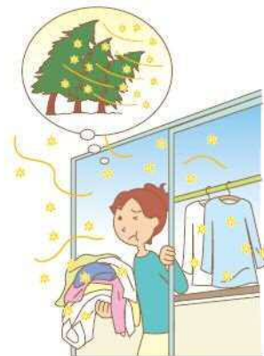
花粉の季節には、せっかく干した洗濯物に大量の花粉が付着。そのまま家に取り込んでしまうこととなります。