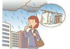
天気予報では晴れ...のはずが、突然夕立ちが降りたりすることもしばしば。外干しの心配の種のひとつです。