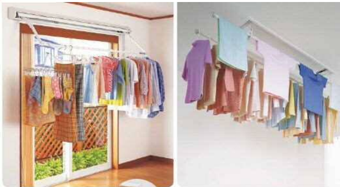
窓越しの日差しを利用できる 壁付けタイプ ひもを引っ張るだけのカンタン操作。