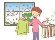
寒冷地であったり、火山灰が舞うなど、お住まいの地域によっては、条件的に外干しにくいことも...